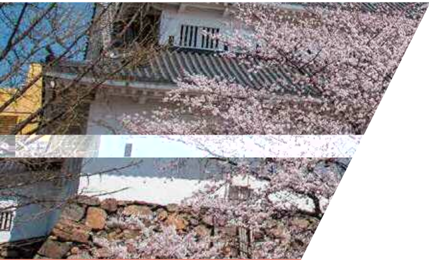
小倉北区 勝山公園

サクラ、ツツジ、ツバキ、ウメなど楽しめます。花見のシーズンには、中腹の園路(観光道路)がサクラのトンネルに。また、桜の馬場は花見客で大にぎわい。