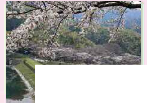
小倉北区 足立公園

サクラ、ツツジ、ツバキ、ウメなどが楽しめます。花見のシーズンには、中腹の園路(観光道路)がサクラのトンネルに。また、桜の馬場は花見客で大にぎわい。