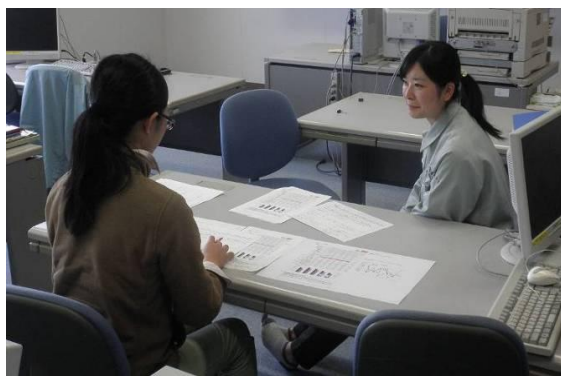
写真1 「個別カウンセリングの様子」

また、行動計画の進捗状況確認、個別現地指導、支部別現地検討会等により、目標達成に向けた取組みの支援を行っている。