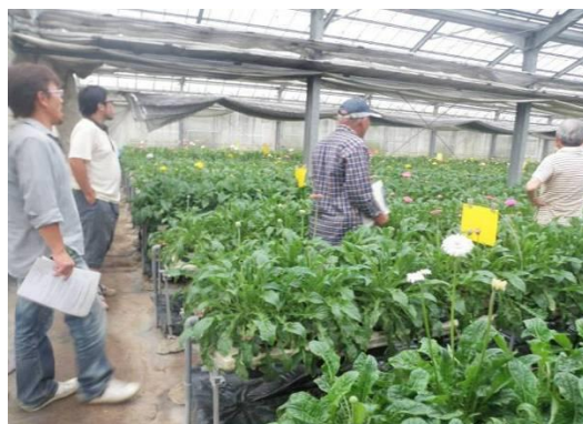
写真2 「ガーベラ現地検討会の様子」